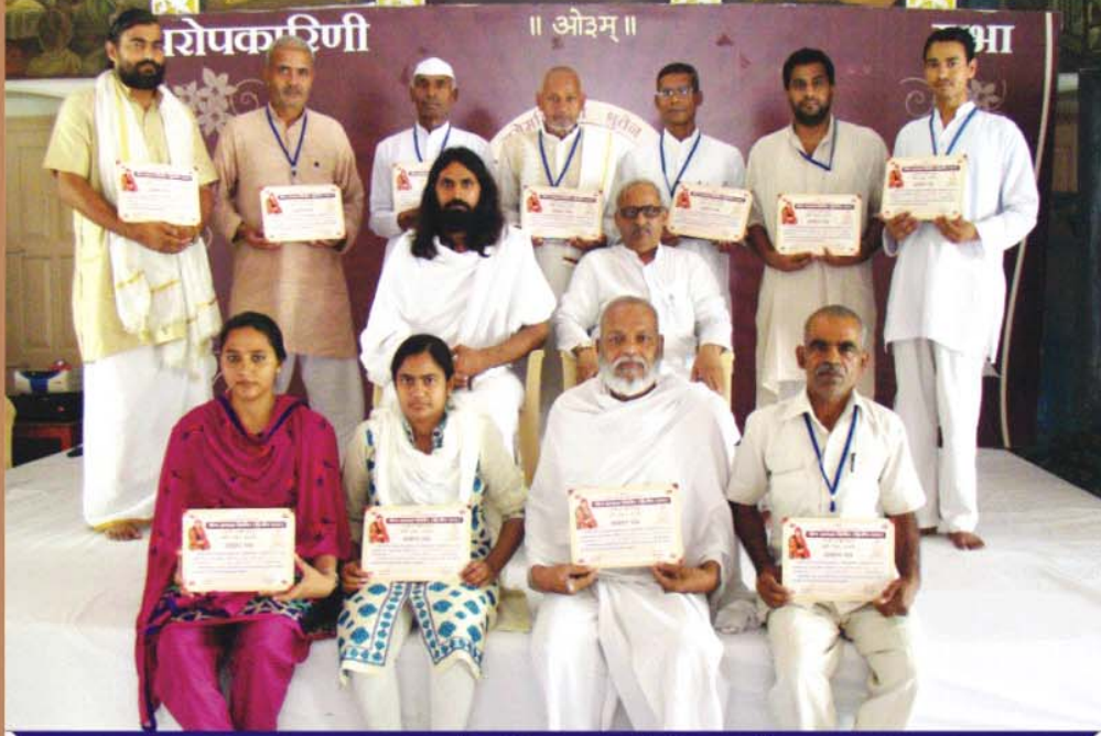
उच्च प्रथम श्रेणी प्राप्त शिविरार्थीगण