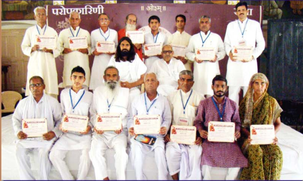
प्रथम श्रेणी प्राप्त शिविरार्थीगण