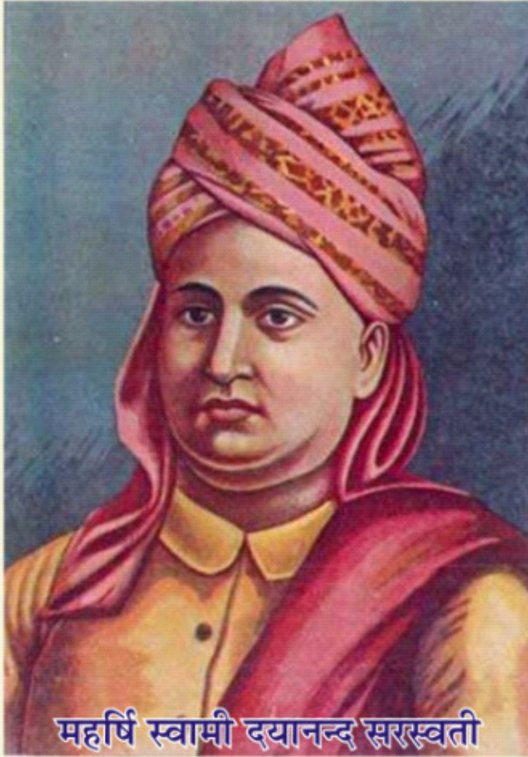
महर्षि स्वामी दयानन्द सरस्वती

वर्ष - ५५ अंक - ३ महर्षि दयानन्द की स्थानापन्न परोपकारिणी सभा का मुखपत्र फरवरी ( प्रथम ) २०१४