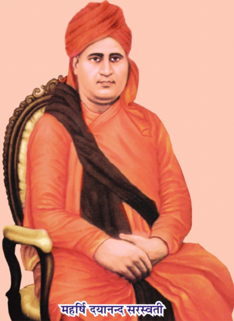
महर्षि दयानन्द सरस्वती

वर्ष - ५७ अंक - १० महर्षि दयानन्द की स्थानापन्न परोपकारिणी सभा का मुखपत्र मई (द्वितीय) २०१५