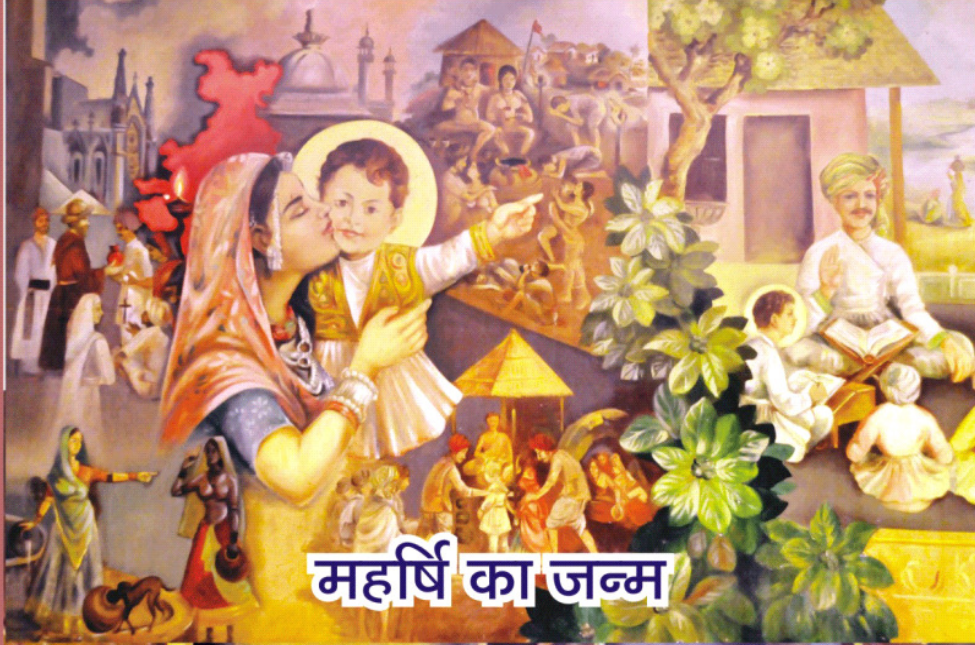
महर्षि का जन्म