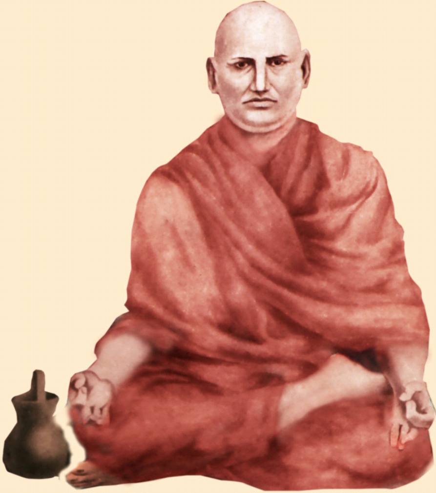
महर्षि स्वामी दयानन्द सरस्वती

वर्ष - ५४ अंक - २२ महर्षि दयानन्द की स्थानापन्न परोपकारिणी सभा का मुखपत्र नवम्बर (द्वितीय) २०१३