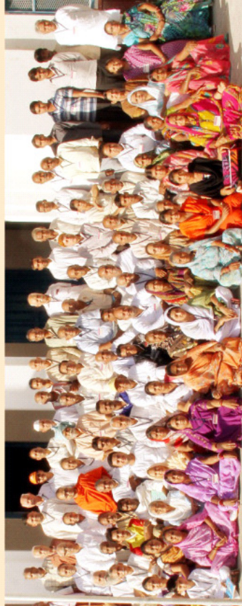
कार्तिक शुक्ल २०७०। नवम्बर (द्वितीय) २०१३

योग-साधना शिविर (प्राथमिक स्तर) २० से २७ अक्टूबर २०१३, ऋषि उद्यान, अजमेर अध्यापकगण व शिविरार्थीगण का सामूहिक चित्र।