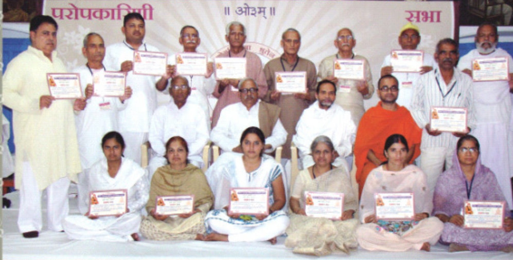
योग-साधना शिविर (प्राथमिक स्तर) में प्रथम स्तर व उच्च प्रथम स्तर प्राप्त शिविरार्थीगण ।