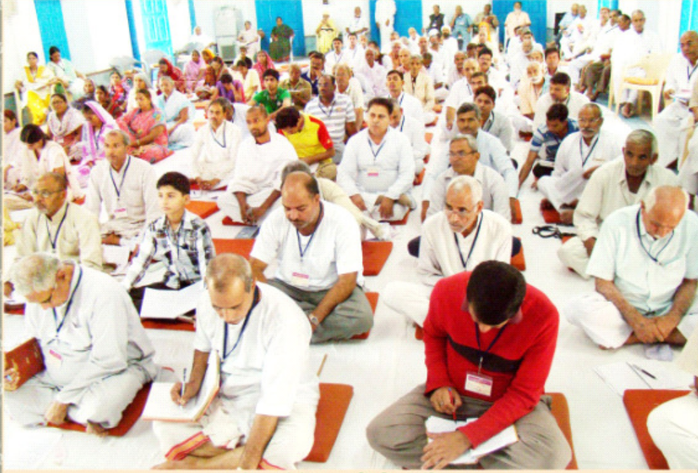
परीक्षा देते हुए शिविरार्थीगण ।